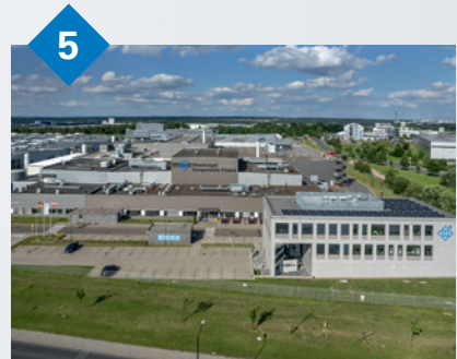
5 Hirschvogel Components Poland Sp. z o.o. Gliwice, Polen Massivumformverfahren: halbwarm sowie mechanische Bearbeitung