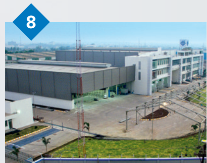
8 Hirschvogel Components India Pvt. Ltd. Sanaswadi, Indien Massivumformverfahren: warm, kalt und halbwarm sowie mechanische Bearbeitung