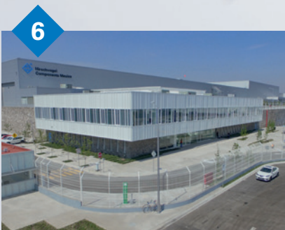
6 Hirschvogel Components Mexico S.A. de C.V. San Juan del Río/Querétaro, Mexiko Massivumformverfahren: kalt, halbwarm sowie mechanische Bearbeitung