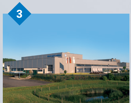
3 Hirschvogel Aluminium GmbH Marksuhl, Deutschland Verfahren: Umformung von Aluminium sowie mechanische Bearbeitung