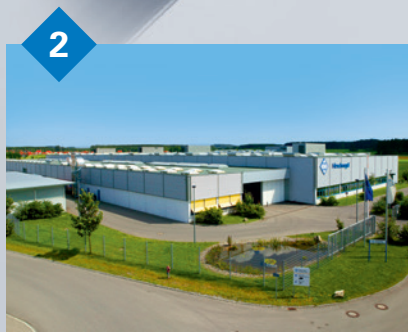
2 Hirschvogel Komponenten GmbH Schongau, Deutschland Verfahren: mechanische Bearbeitung und Montage zu einbaufertigen Funktionsbaugruppen