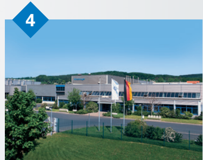
4 Hirschvogel Eisenach GmbH Marksuhl, Deutschland Massivumformverfahren: warm, kalt und halbwarm