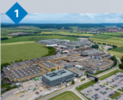
1 Hirschvogel Umformtechnik GmbH Denklingen, Deutschland Massivumformverfahren: warm, kalt, halbwarm und Kombinationen sowie mechanische Bearbeitung