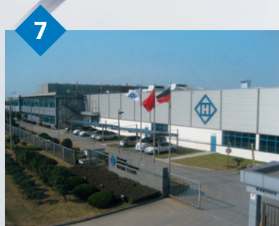
7 Hirschvogel Automotive Components (Pinghu) Co., Ltd. Pinghu, China Verfahren: Umformung warm, kalt und halbwarm von Stahl und Aluminium sowie mechanische Bearbeitung